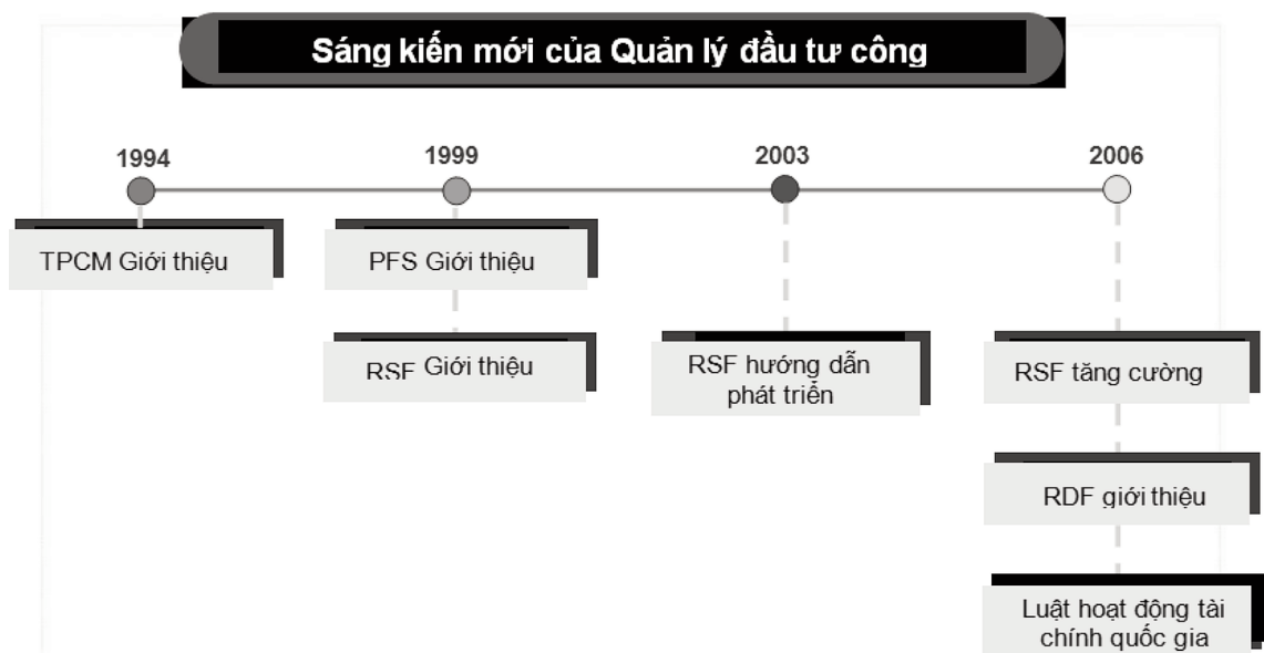
Sơ đồ 1